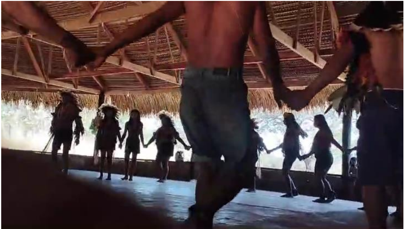
DANÇA DE INAUGURAÇÃO