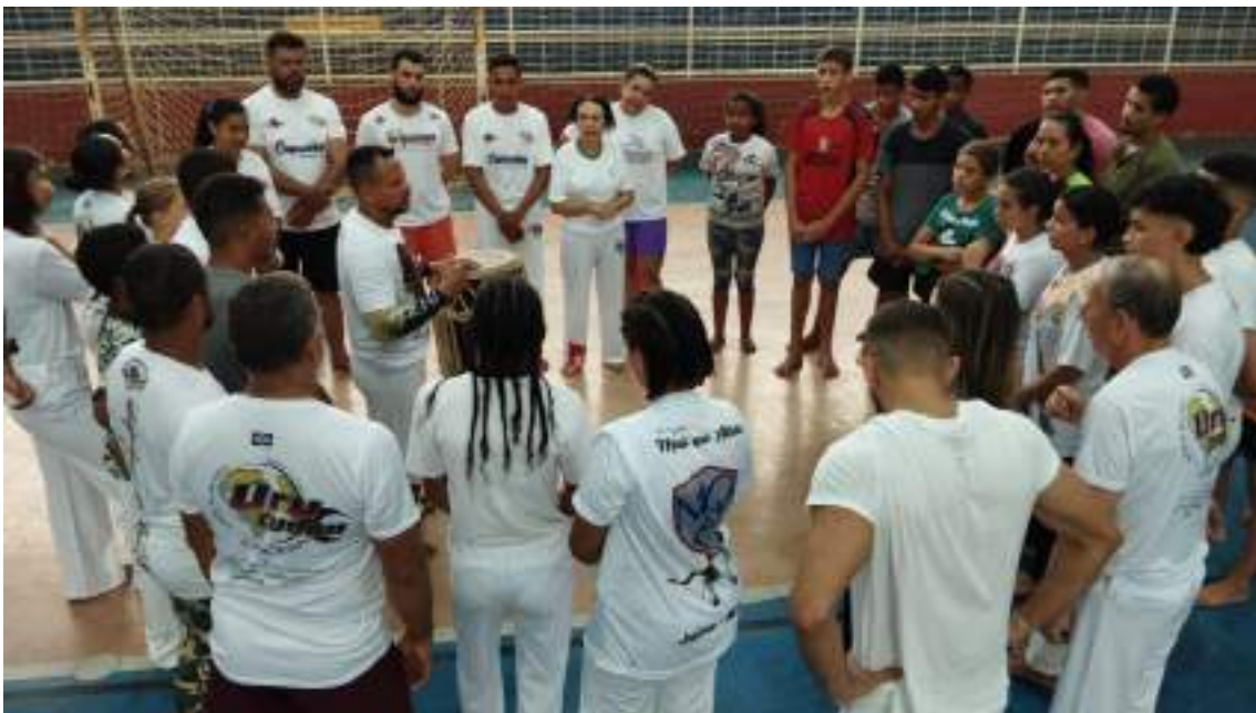
Oficina Temática: Musicalidade e Ritmo