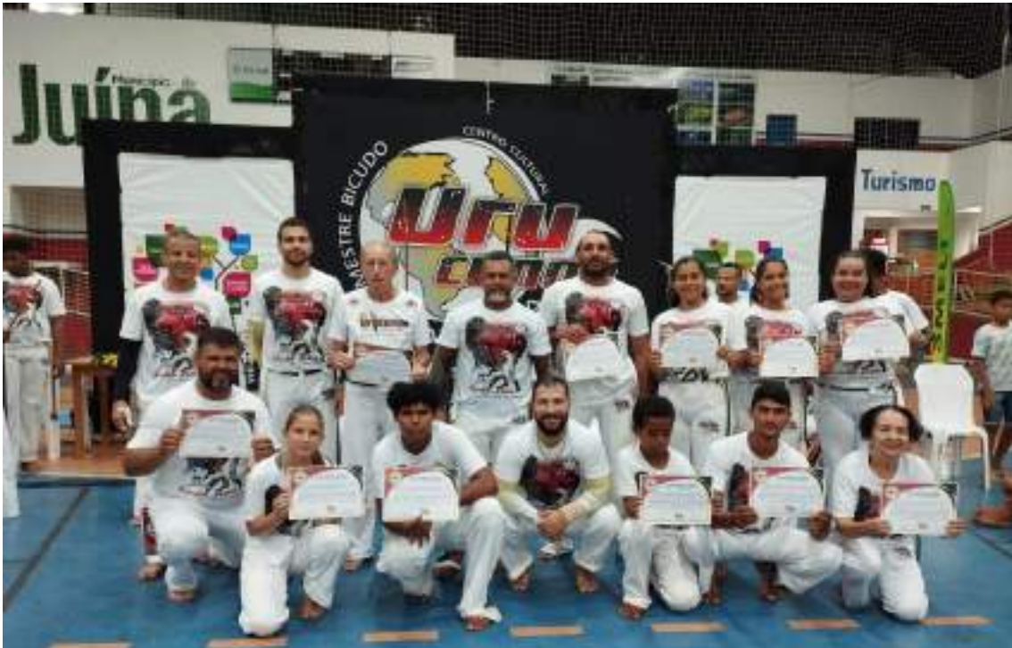
Certificação dos alunos com a troca de cordas (Adultos)