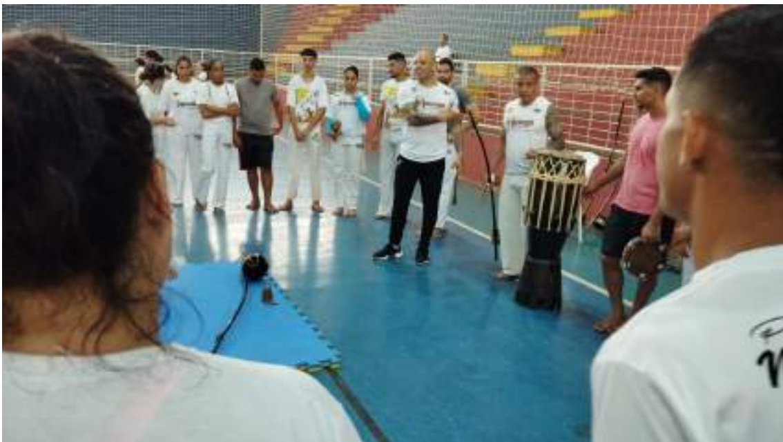
Oficina temática: Berimbau