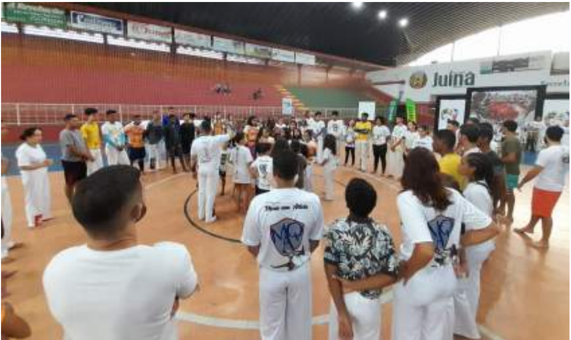
Oficina Temática: Instrumentos Musicais