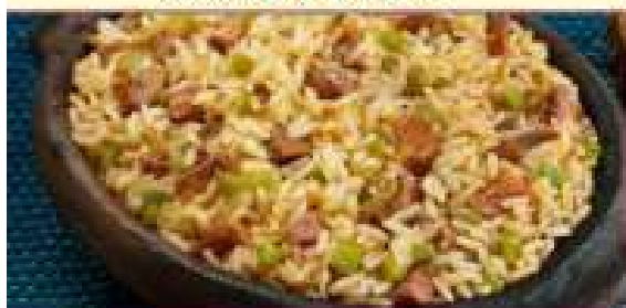
Farofa de Banana