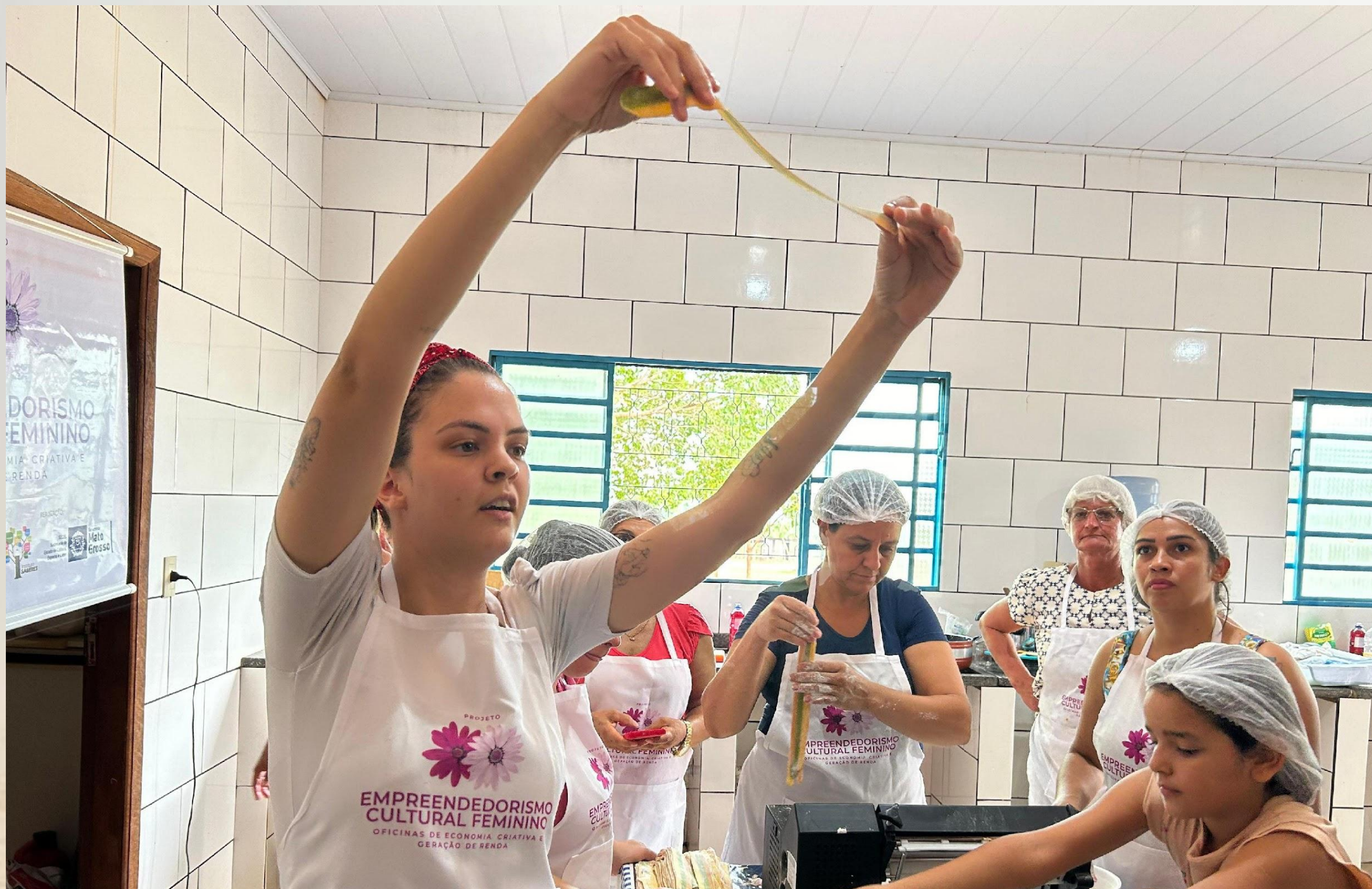
OFICINA DE CULINÁRIA NA ÁREA URBANA