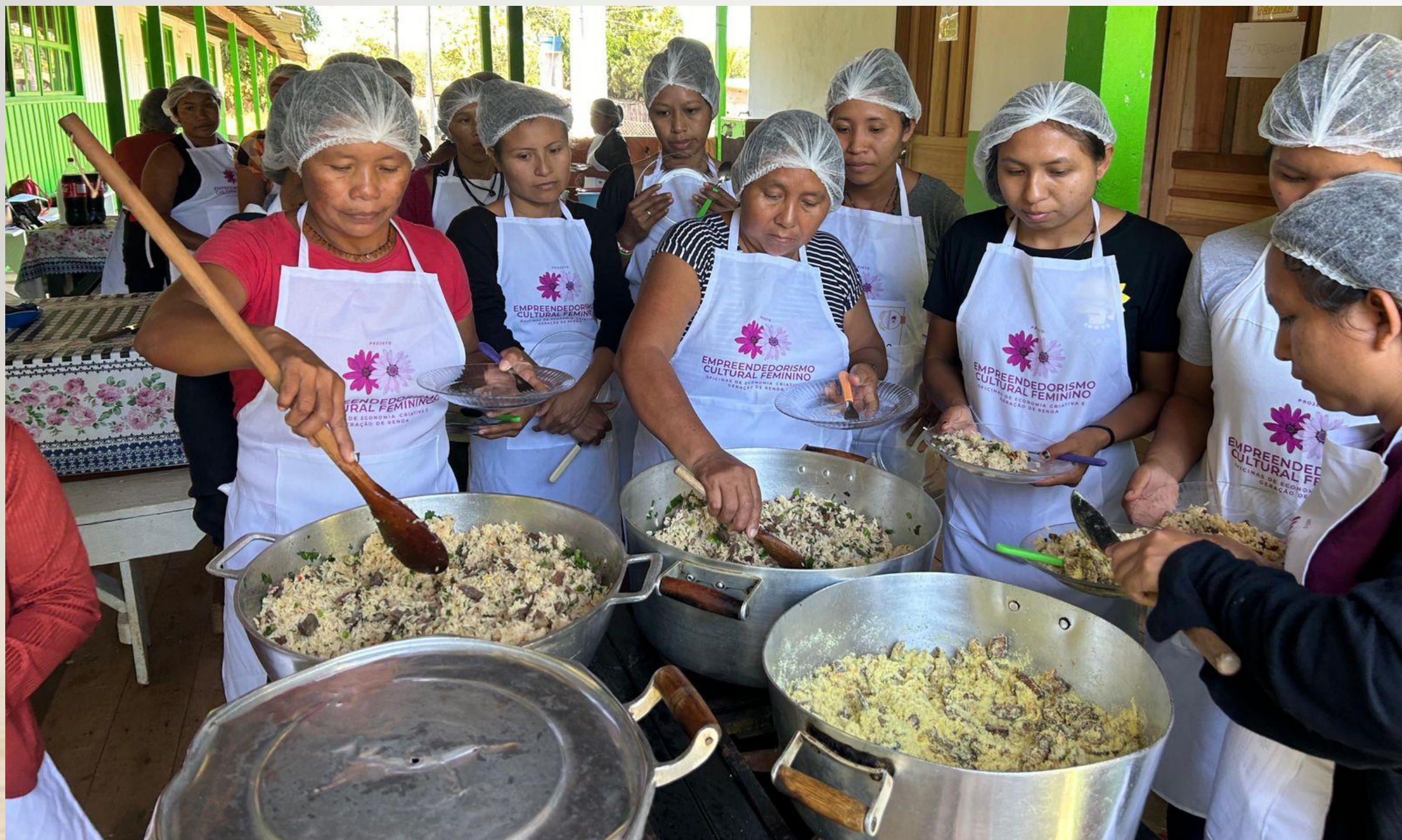
OFICINA DE CULINÁRIA NA ÁREA INDÍGENA