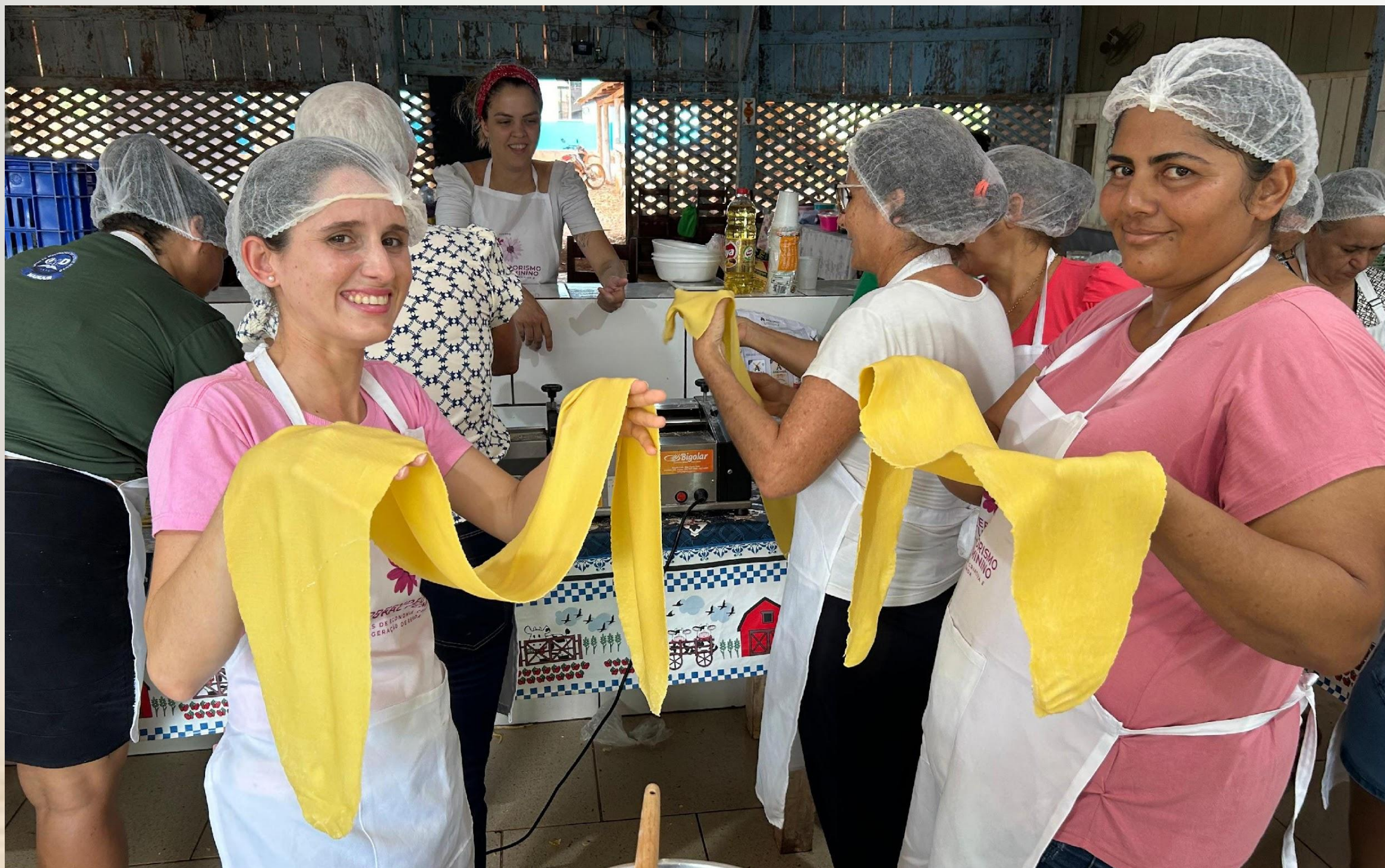
OFICINA DE CULINÁRIA NA ZONA RURAL