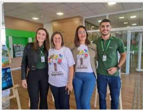
Associação André Luiz.

Através do Instituto Saberes, o projeto Estação Saberes, encontra com cursos e atividades sociais em vários locais da cidade de Juína/MT.