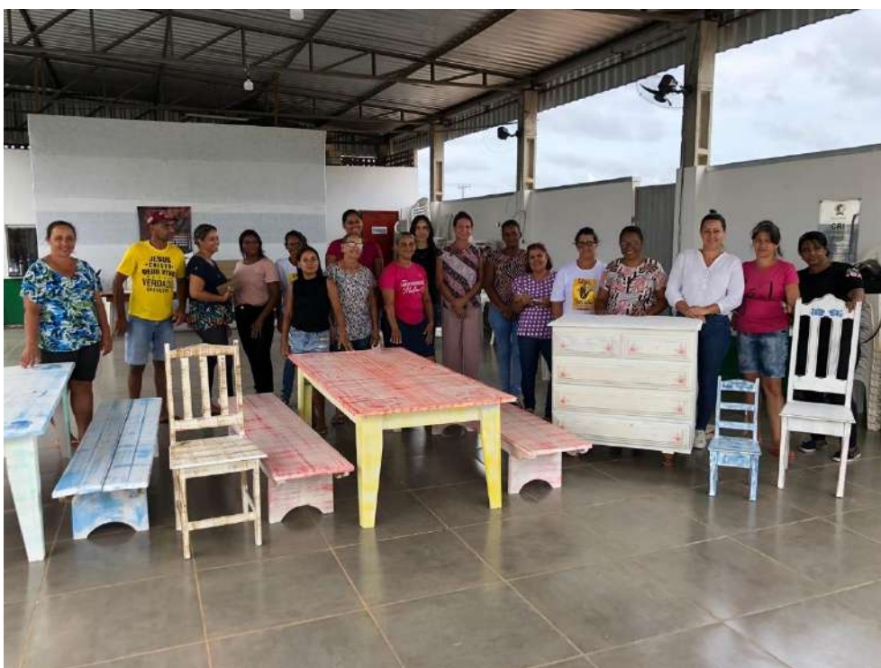
Encerramento do curso e abertura da exposição dos móveis restaurados para a comunidade.