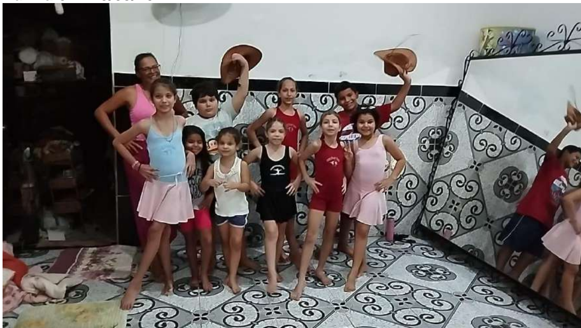
Turma 01 - 25/03/2024