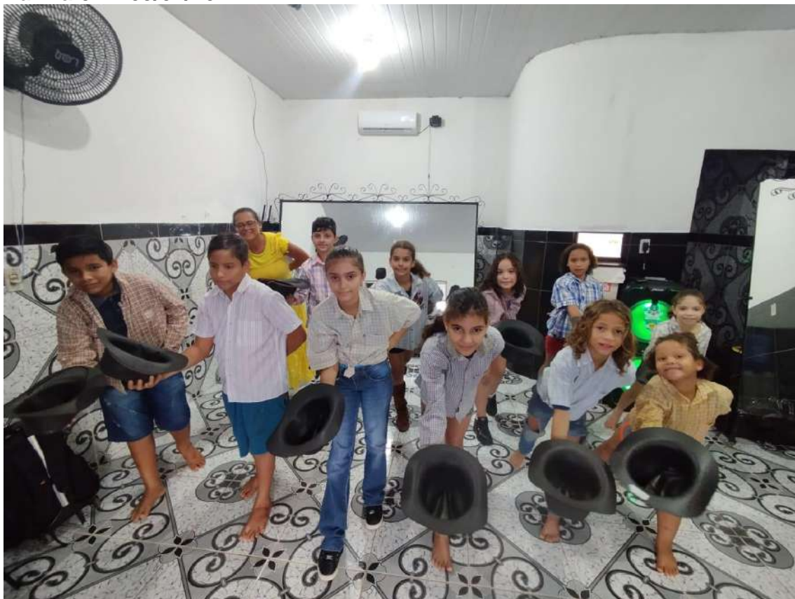
Turma 02 – 09/04/2024