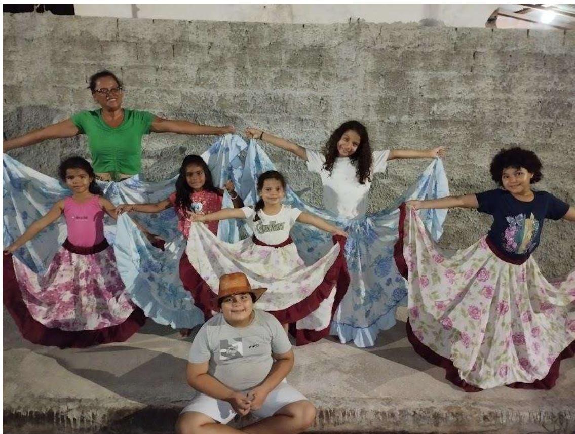
Turma 01 – 22/04/2024