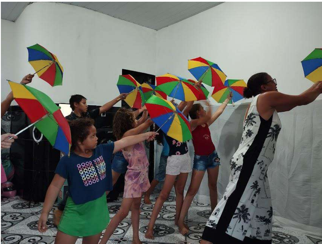
Turma 02 – 30/04/2024