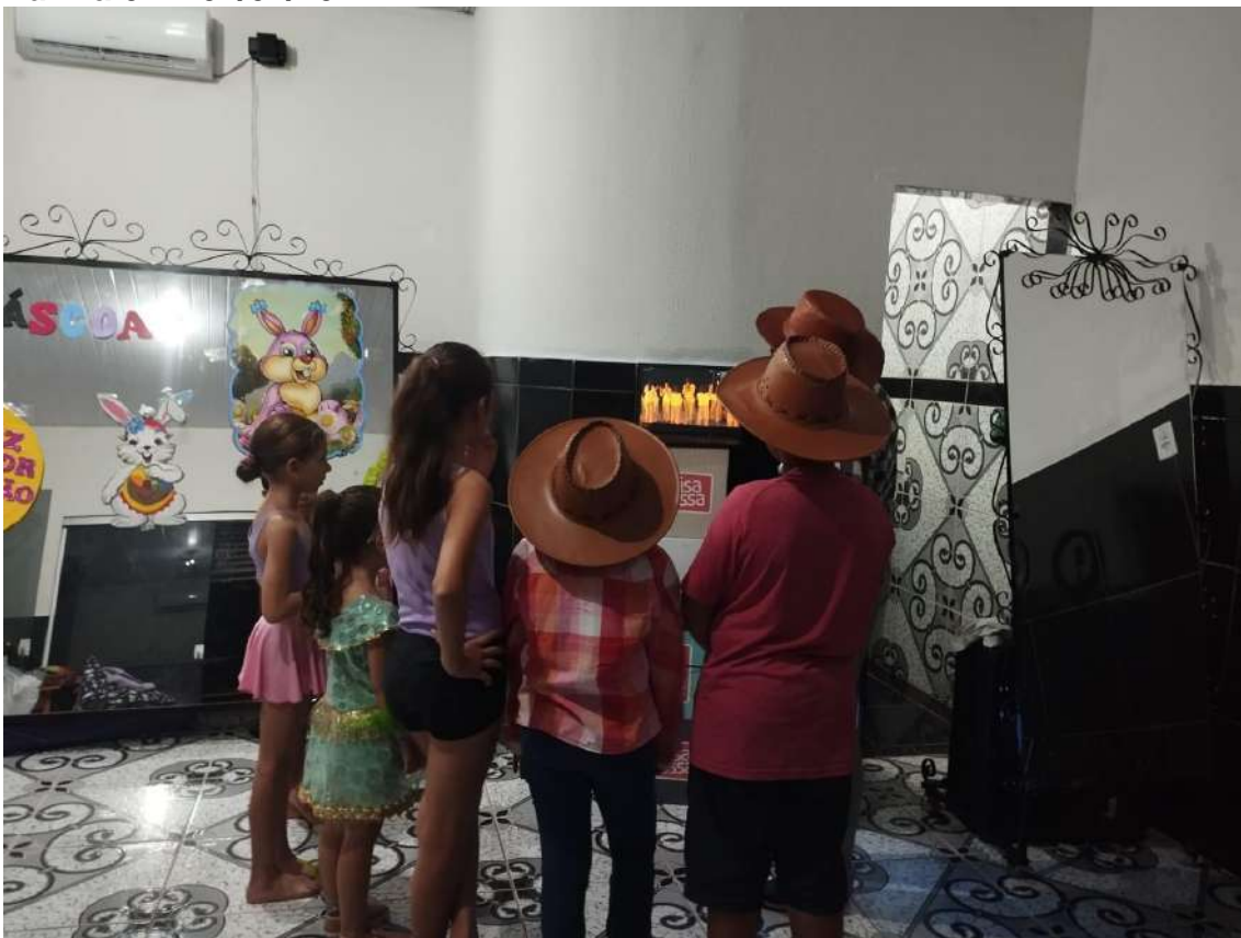
Turma 01 – 01/04/2024