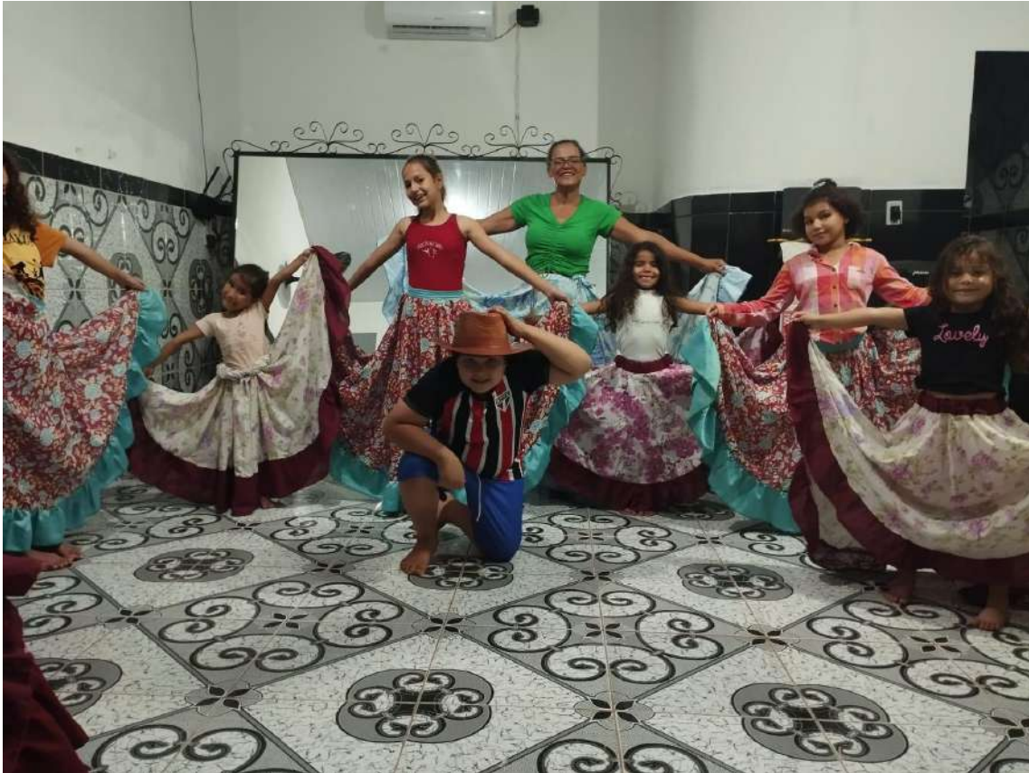
Turma 01 – 08/04/2024