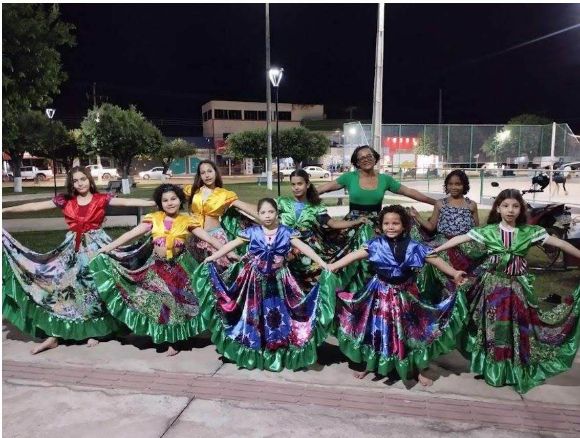
Turma 02 – 18/06/2024