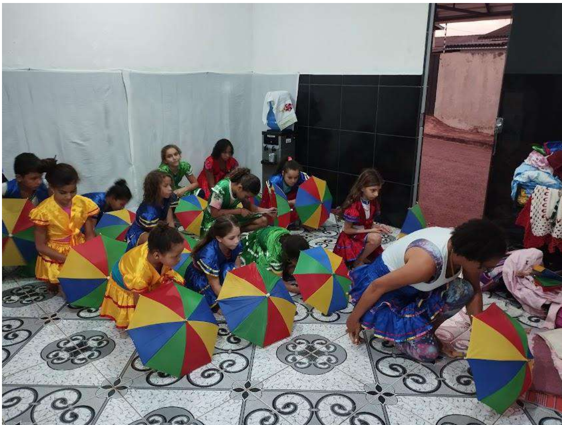
Turma 02 – 04/06/2024