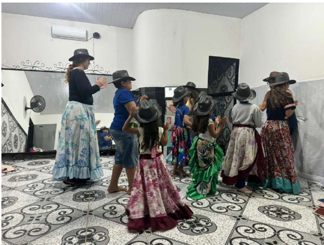
Turma 01 – 27/05/2024