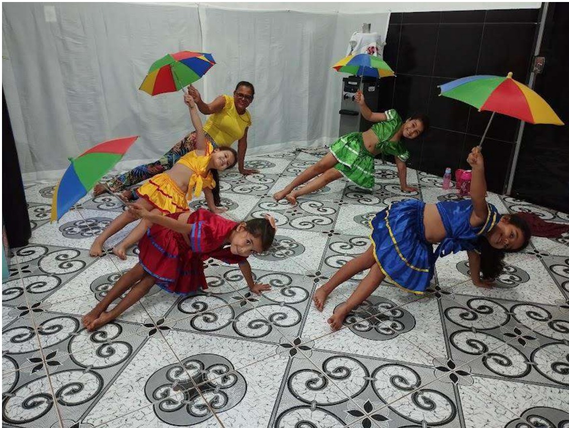
Turma 01 – 03/06/2024