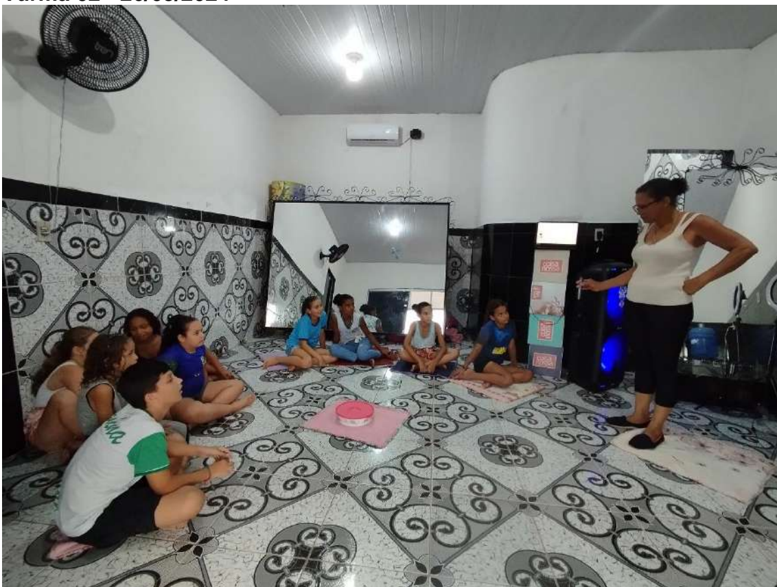
Turma 02 - 26/03/2024