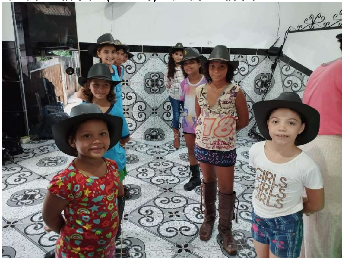
Turma 01 – 15/04/2024 (FERIADO) - Turma 02 – 16/04/2024