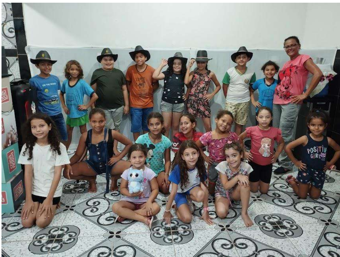
Turma 01 – 06/05/2024