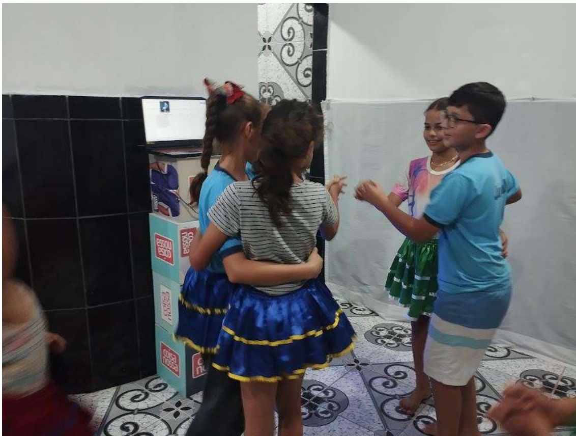
Turma 02 – 11/06/2024