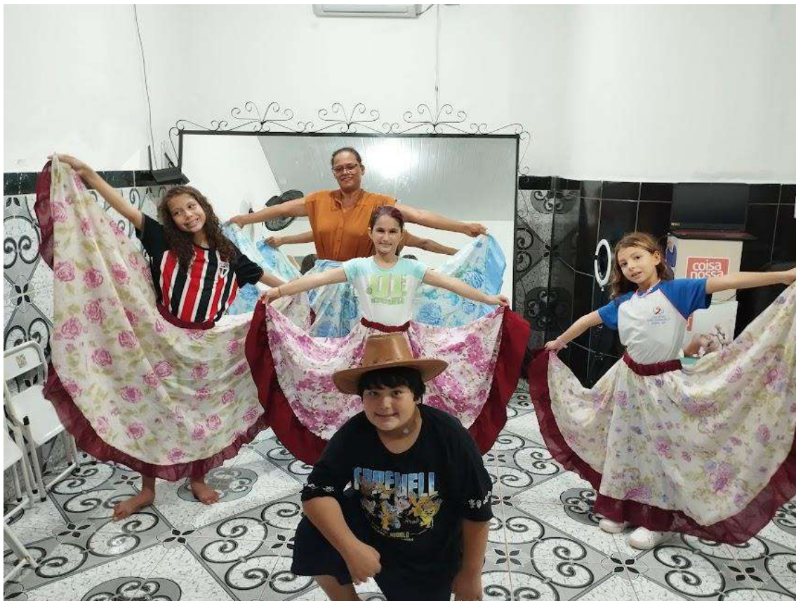
Turma 01 – 29/04/2024