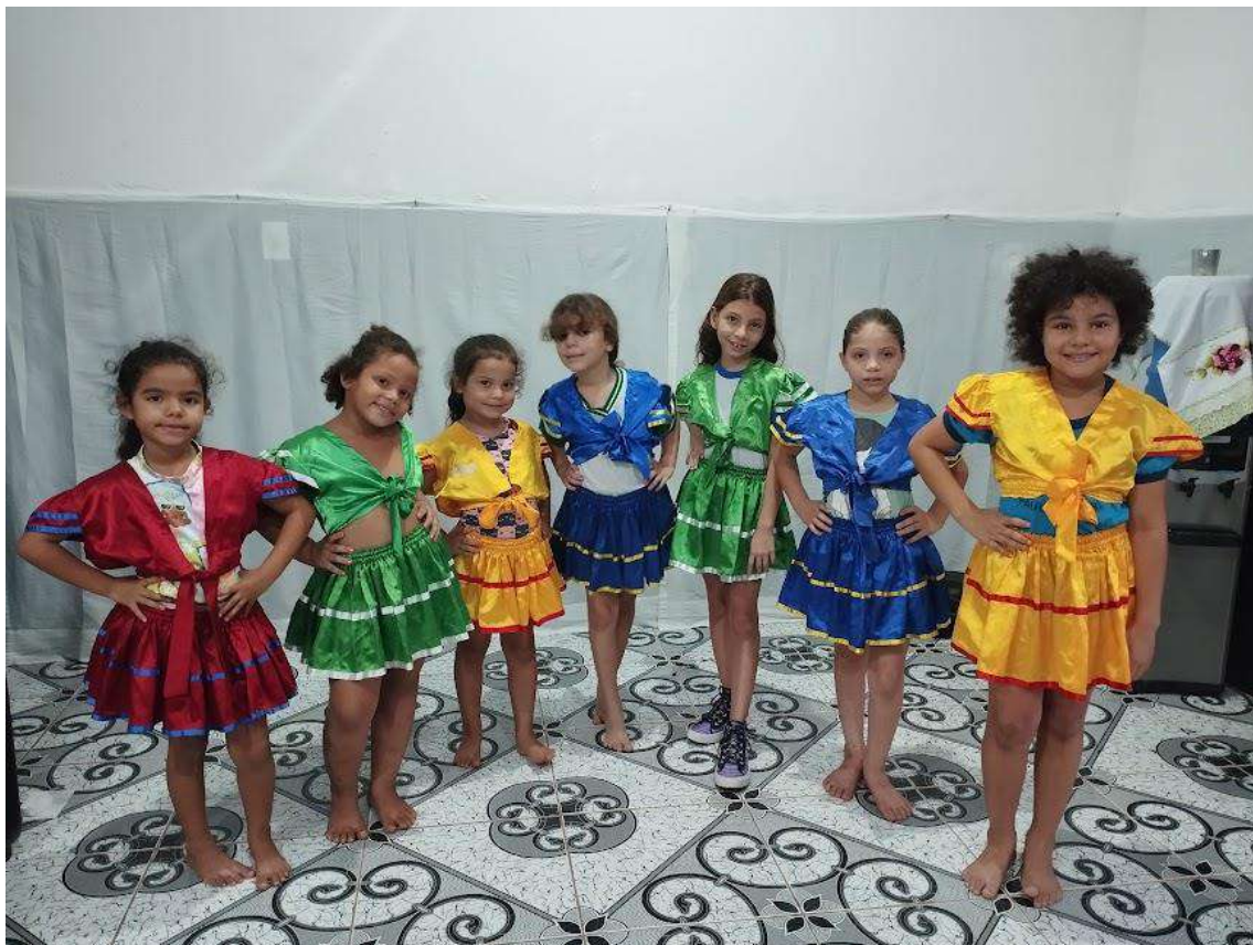
Turma 02 – 07/05/2024