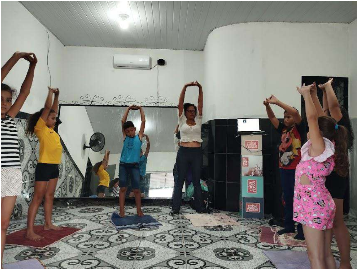
Turma 02 – 21/05/2024