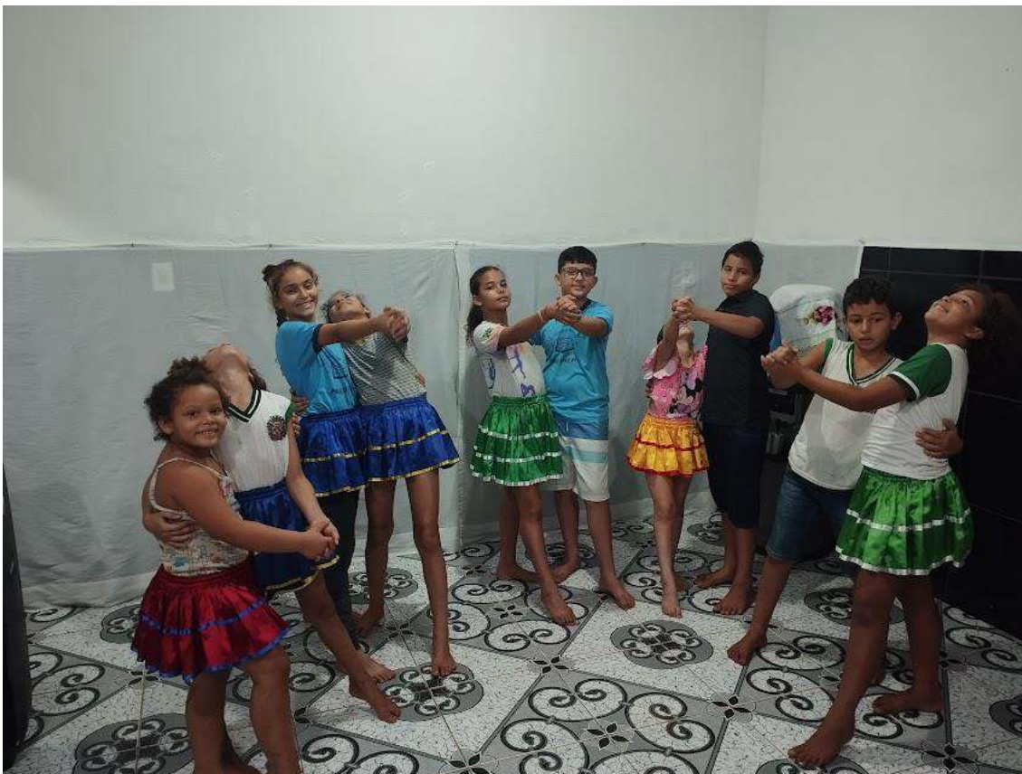
Turma 01 – 10/06/2024