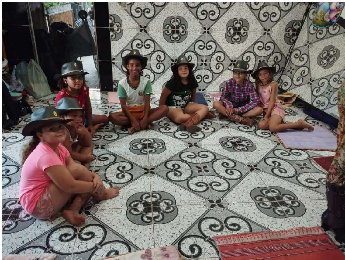
Turma 02 – 03/04/2024