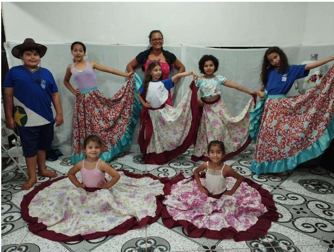
Turma 01 – 17/06/2024