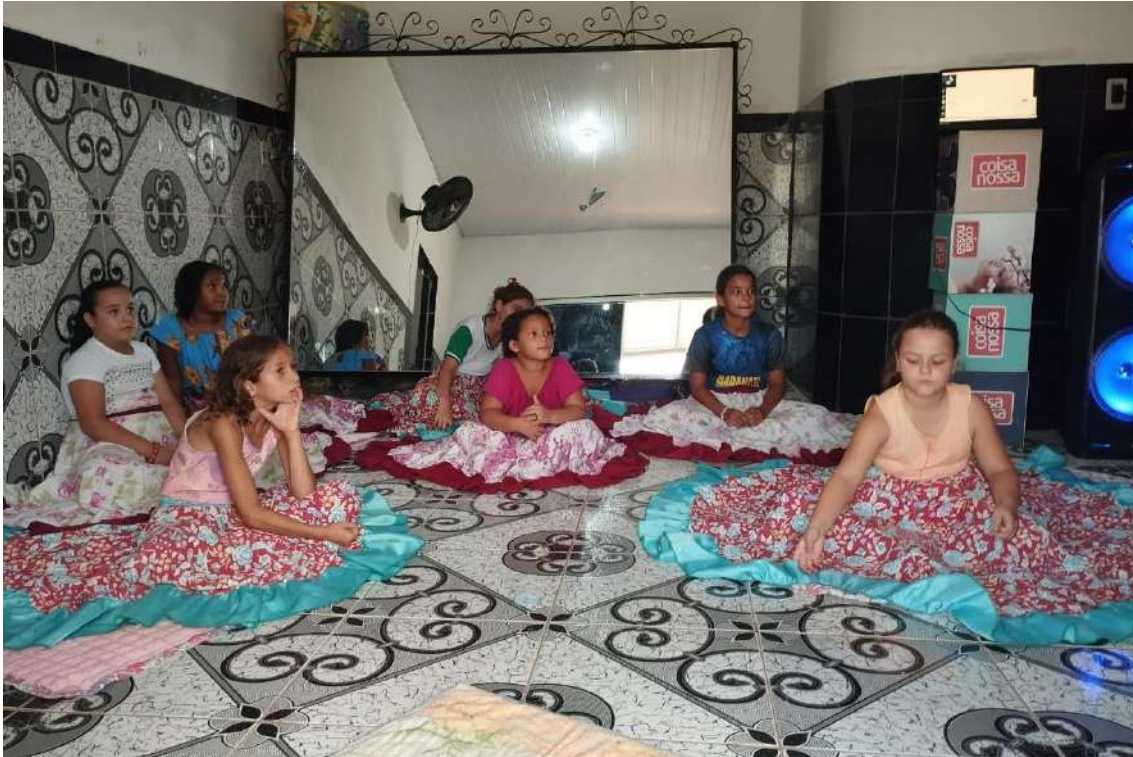
Turma 02 - 19/03/2024