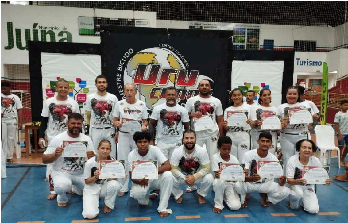
Certificação dos alunos com a troca de cordas (Adultos)